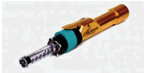
De behandeling met de Shireen-methode (links) en de Porejet (boven).

Er zijn drie sessies nodig om het gewenste effect te bereiken, maar met een ongelooflijk natuurlijk resultaat!