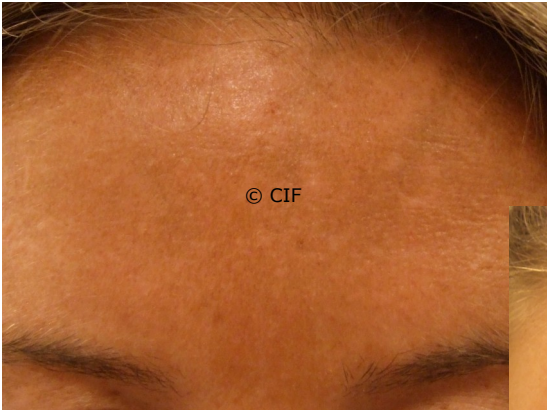
Voor (links) en na (beneden) één behandeling